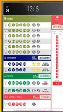
*medidas ancho x alto

25 años acompañando a las Administraciones de Lotería y Receptores Mixtos. Con motivo de nuestro aniversario, REDUCIMOS LOS PRECIOS de casi todos nuestros productos.